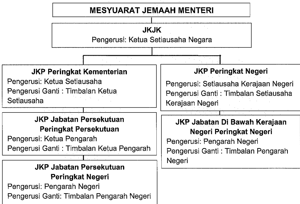
Rajah 1: Hubungan Aliran Tadbir Urus Keselamatan Perlindungan Kerajaan