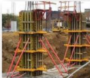
Formwork with Inspection