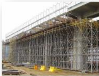
Scaffolding with Inspection

We have expertise and Our years of experience in the construction industry enables us to quickly solve day to day problems as they arise on site with ease and our proactive approach